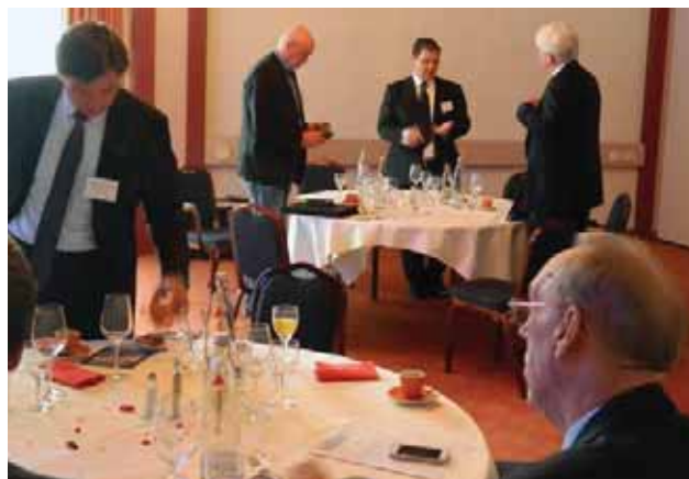
Networking beim Business Lunch Karlsruhe